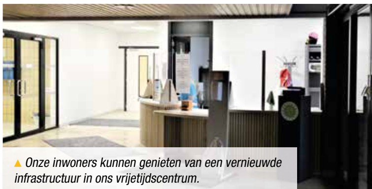
▲ Onze inwoners kunnen genieten van een vernieuwde infrastructuur in ons vrijtijdscentrum.

Het gebouw dateert van de jaren '70. Het voldeed niet langer aan de huidige normen en had nood aan een opknapbeurt. Nu kan het pronken met een volledig gerenoveerd dak, een vernieuwde inkombalie en opgefriste groepskleedkamers in het zwembad.