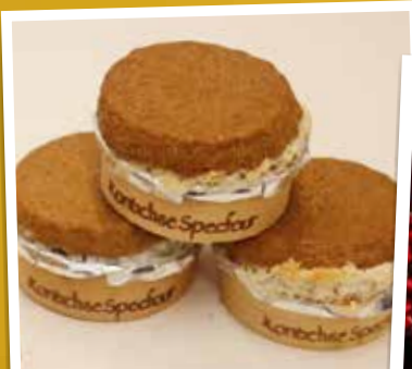
Ons dorpsproduct Specfour werd erkend als streekproduct.

2017 was een leuk en druk jaar. Denken we maar aan Vlaanderen Feest in het gemeentepark.