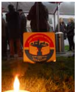
▲ BIN de Reep is het eerste buurtinformatienetwerk van Kontich.