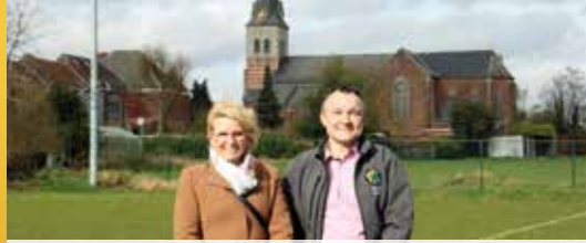
Waarloos aan de beurt - Masterplan (p. 2)