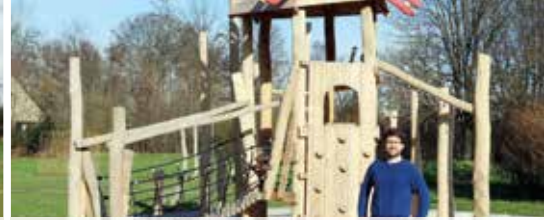
Kom spelen in onze vernieuwde speeltuin Wild Veld (p. 3)