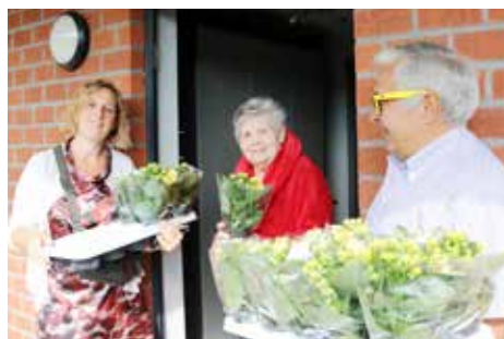
▲ Op de enige echte Moederdag deelde een enthousiaste N-VA-ploeg bloemetjes uit op de wekelijkse zaterdagmarkt. Ook in de serviceflats van Altena, het woon- en zorgcentrum De Hazelaar en de Duffelse volkswoningen in Waarloos werden de moeders in de bloemen gezet. Met dank aan het bloemen- en plantencentrum Van Uytzel.