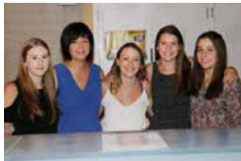
▲ De tapploeg