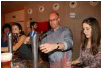
▲ Uw burgemeester aan de tap