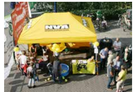
▲ N-VA Kontich-Waarloos zal op zaterdag 24 en zondag 25 september aanwezig zijn op de jaarlijkse braderij. Kom kennismaken met onze mandatarissen.