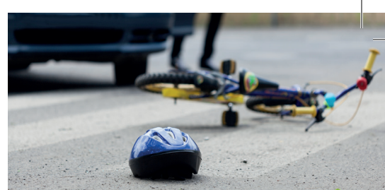
Minder ongevallen in Kontich p.3