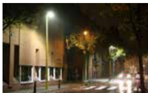
▲ Ledverlichting aan Sint-Jozefsschool

Anno 2017 stellen we vast dat er globaal een snellere doorstroming is van het verkeer en minder file in totaal. Er zijn ook 18 % minder ongevallen met letsels.