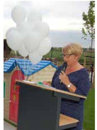
Opening kinderdagverblijf 't Wisterke ►